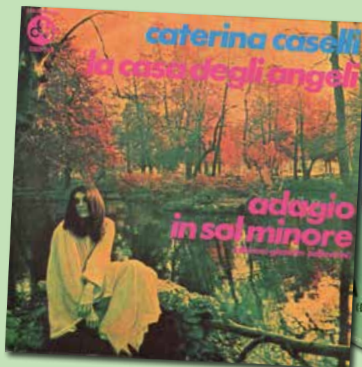
La casa degli angeli - Caterina Caselli 45 giri CGD 120 (1971)