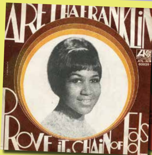
Chain of Fools - Aretha Franklin

Nel pieno del successo, nel '67, Aretha Franklin incide Chain of Fools inizialmente solo su 45 giri. Basta solo qualche settimana e il singolo si piazza al "numero uno" della classifica Billboard Hot Rhythm & Blues degli Stati Uniti rimanendo al vertice per quattro settimane, e al numero 2 in quella Hot 100, sempre di Billboard superato dal solo Judy In Disguise (With Glasses) di John Fred e la sua Playboy Band. Il produttore della Atlantic Records tale Jerry Wexler aveva messo sotto contratto Don Covay appositamente per scrivere canzoni da far incidere a Otis Redding, artista appartenente allo stesso team Atlantic. Ma in questo caso il musicista capisce che il pezzo è più adatto ad una voce femminile, così viene dirottato ad Aretha. Tanto è il successo che la cantante americana inserisce Chain of Fools in molti suoi album tanto da rimanere nel tempo un classico del suo repertorio. Il testo parla di una ragazza che pur sapendo che il suo uomo la tradisce non riesce a staccarsi da lui... troppo debole io, troppo forte lui dice, anche se spera che un giorno questa catena si spezzi. Il suo autore Don Co-