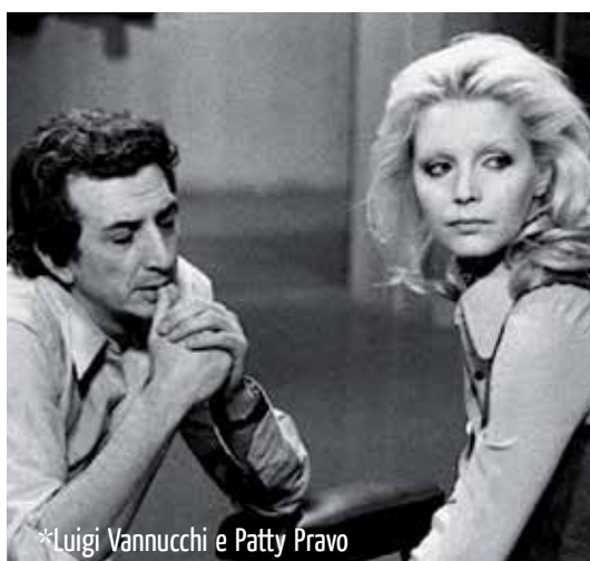
*Luigi Vannucchi e Patty Pravo

Nel gennaio del 1972 il canale nazionale propone la mini serie in 5 puntate A come Andromeda , prima fiction televisiva a carattere fantascientifico che inchiederà al piccolo schermo milioni di italiani.