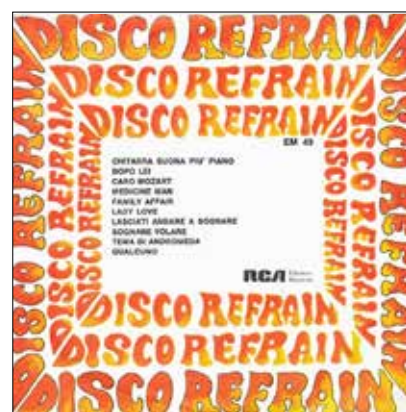
1972 Tema di Andromeda - Disco Refrain Lato B (It) LP 7" RCA EM 49 €50