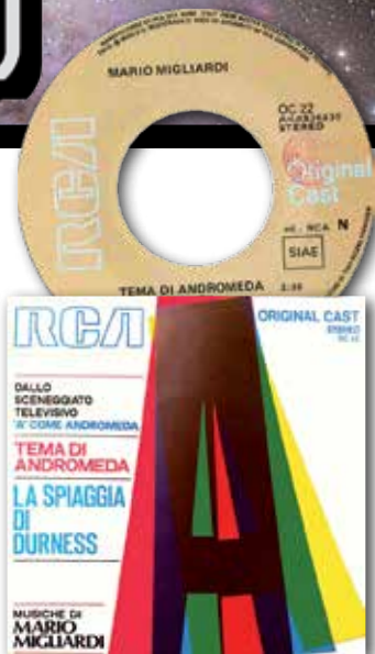
1971 Tema di Andromeda / La spiaggia di Durness (It) 45 giri RCA Original Cast OC 22 €150

Il singolo originale RCA contenente due temi dallo sceneggiato, è molto raro poiché stampato in un numero esiguo di copie, quotava sino ad una decina di anni fa circa 200 euro; valore poi ridimensionato dalla pubblicazione del cd con lo score completo di Migliardi. Rimane tuttavia un pezzo molto ricercato ed ambito, come del resto quasi tutta la discografia del compositore costituita prevalentemente da singoli e album di colonne sonore per film "minori". Un altro pezzo interessante è costituito dal lp compilation in formato 7" della serie "Disco Refrain", esattamente il n. 49, promo fuori commercio che contiene appunto il Tema di Andromeda .