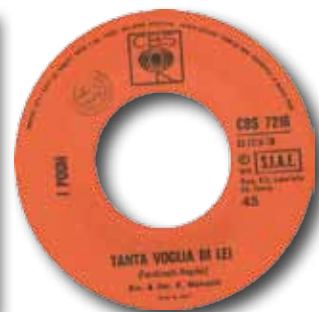
1971 Tanta voglia di lei / Tutto alle tre 45 giri / CBS7216 €15

C on l'exploit di Tanta voglia di lei , nell'estate '71, si spalanca la strada del grande successo popolare per i Pooh. In sei anni di militanza alla CBS il quartetto, che nel frattempo cambia qualche componente (Valerio Negrini e Riccardo Fogli per far posto a Stefano D'Orazio e Red Canzian), realizza undici 45 giri e sei album, oltre ad una raccolta di successi. E' questo il momento, probabilmente più creativo del gruppo grazie soprattutto a 33 giri quali Parsifal , Alessandra e Un po' del nostro tempo migliore . Viste le numerose ristampe (trattandosi tutti di album di grande successo commerciale) a volte è difficile individuare anche per i fan-collezionisti più esperti, la copia originale del singolo supporto.