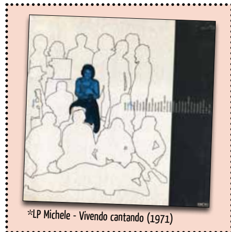
*LP Michele - Vivendo cantando (1971)

il 33 giri più venduto dell'anno in seno alla RiFi. Vista la funzionale formula di dedicare un intero album ad un particolare autore, l'anno successivo Iva incide Caro Aznavour... riprendendo il repertorio dell'artista armeno, naturalizzato francese, Charles Aznavour. Sulla linea pacifista intrapresa con Theodorakis, la Zanicchi coglierà un ottimo successo a Un Discorso per l'Estate '71 , con La riva bianca la riva nera , ma in questo caso affidandosi ad autori italiani, musica di Eros Sciorilli, testo di Alberto Testa. Allo stesso concorso radio-televisivo organizzato dalla Rai, partecipa con