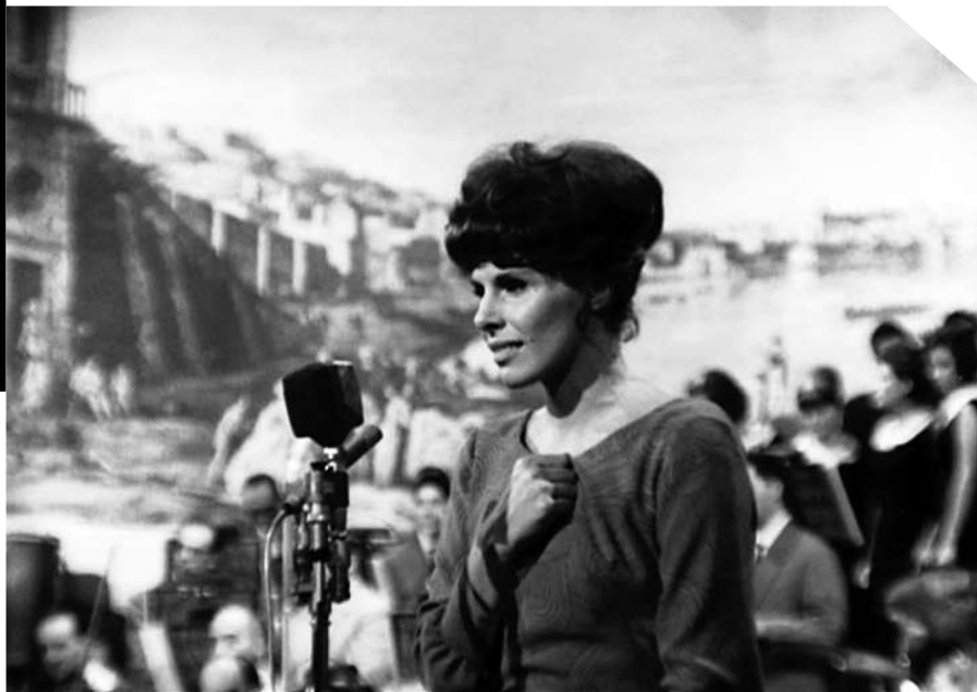
Ornella vanoni al Festival di Napoli 1964